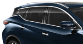
Темно-синий — RBG