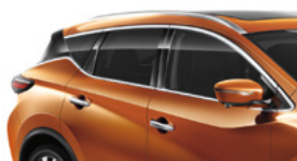
Оранжевый — EAW