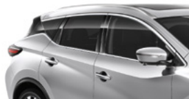
Серебристый — K23