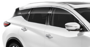
Белый перламутр — QAB