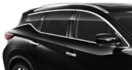
Черный — G41