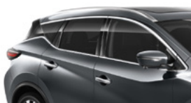
Темно-серый — KAD