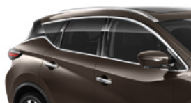
Серо-коричневый — CAM