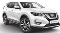
QM1/S — Белый