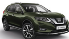
ЕАН/М — Оливковый