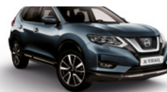
RAQ/М — Синий