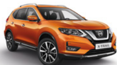
ЕВВ/М — Оранжевый