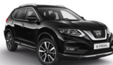
G41/М — Черный