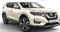
QAB/PM — Белый перламутр