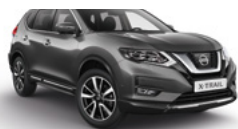
KAD/М — Серый