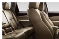
Бежевая кожа с перфорацией