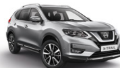
K23/М — Серебристый